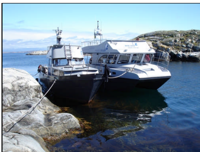
Dykläger i Bohuslän

Vår filosofi är att individanpassa dykutbildningen. Antalet deltagare i såväl praktik som teori begränsas därför till 4-8 elever.